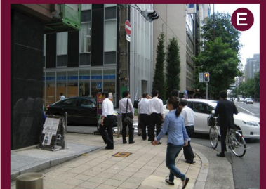
E. 「道修町」→「平野町1」→ 「淡路町1」交差点を直進、 次の「瓦町1」交差点で左折 (左手角にはローソン)