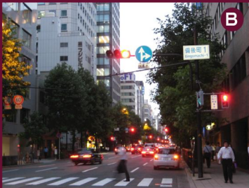
B. 「本町1」→「安土町」→ 「備後町1」交差点を直進。