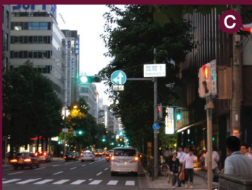
C. 「瓦町1」交差点で右折。 (右手角にはローソン)