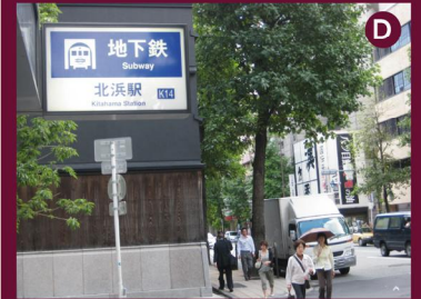
D. 地下鉄堺筋線 「北浜駅」5番出口。 堺筋を南方向へ。 (車の進行方向と逆)