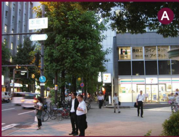
A. 地下鉄堺筋線 「堺筋本町駅」12番出口、 堺筋を北方向へ。 (車の進行方向と同じ)